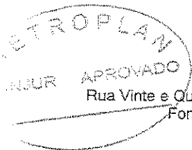
Diretor Administrativo da METROPLAN